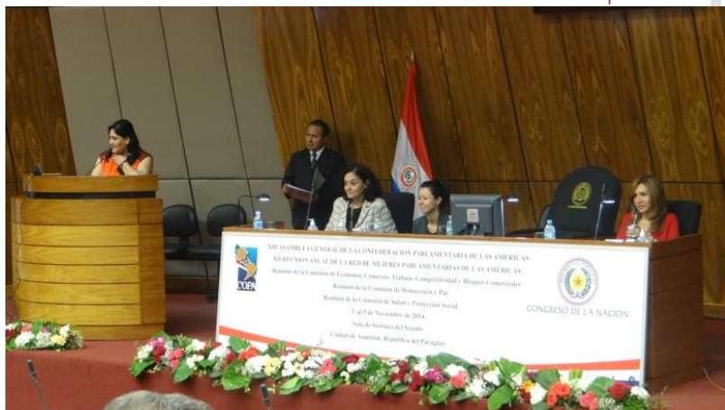
Presentación de la Presidenta de la Red de Mujeres y discusiones con los participantes de la Reunión Anual