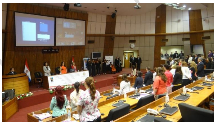
Apertura de la Reunión Anual de la Red Asunción, Paraguay, 4 de noviembre 2014

Para nuestra primera actividad del año 2015, me complace que la Red se reúna en San Juan, sede de la primera Reunión anual de la Red celebrada en 2000. En aquel evento, se organizó el primer taller para mujeres parlamentarias con la participación de expertas de ONU Mujeres sobre el tema de La mejora de los derechos económicos de las mujeres en las Américas . Aquel taller desembocó en la adopción de una recomendación sobre el mismo tema. Fue también en aquel evento en que se adoptaron los Estatutos que desde entonces regulan el funcionamiento de nuestra organización.