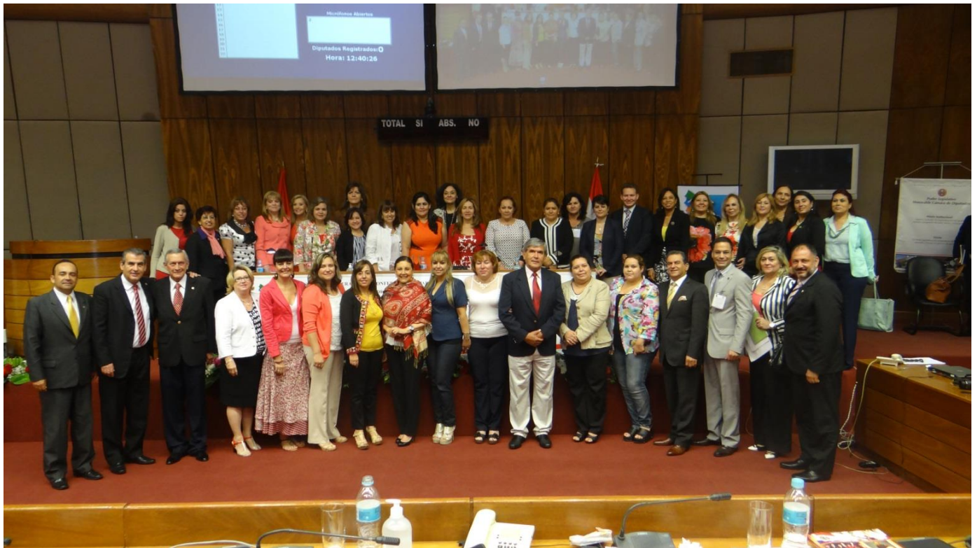
Las participantes de la Reunión Anual de la Red de Mujeres Parlamentarias de las Américas 4 de noviembre de 2015, Asunción, Paraguay

El informe de la última reunión del Comité Ejecutivo llevada a cabo en Montego Bay, Jamaica, el 29 de marzo de 2014, así como el orden del día de la Reunión anual del día siguiente fueron adoptados sin modificación.