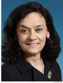
RITA LC DE SANTIS

Diputada de la Asamblea Nacional de Québec