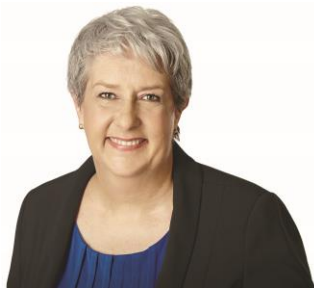
MARIE BOUILLÉ Députée de l'Assemblée nationale du Québec