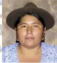
Región Andina / Andean Region / Região Andina / Région andine Segundina Flores Solamayo, Diputada Cámara de Diputados de la Asamblea Legislativa del Estado Plurinacional de Bolivia