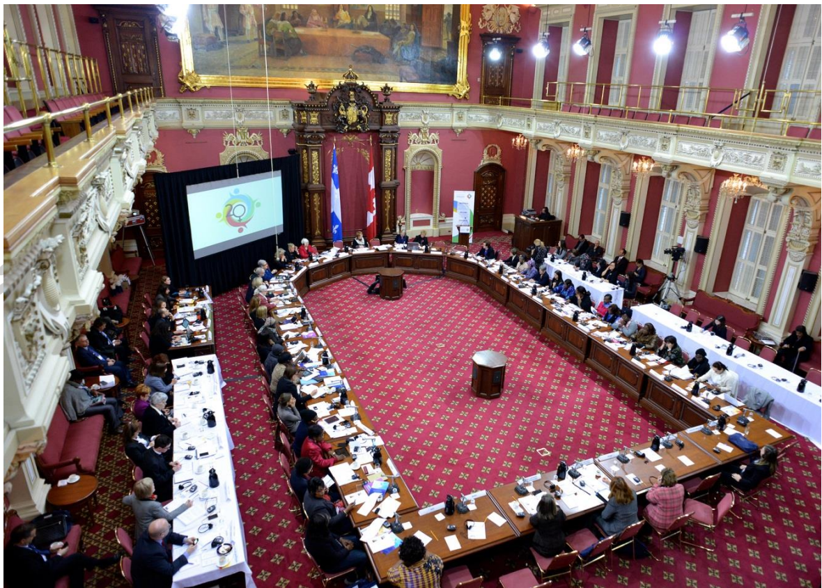
Séminaire interparlementaire, Québec