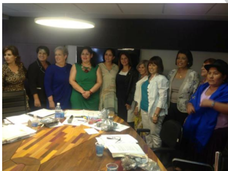
Les membres du Comité exécutif du Réseau