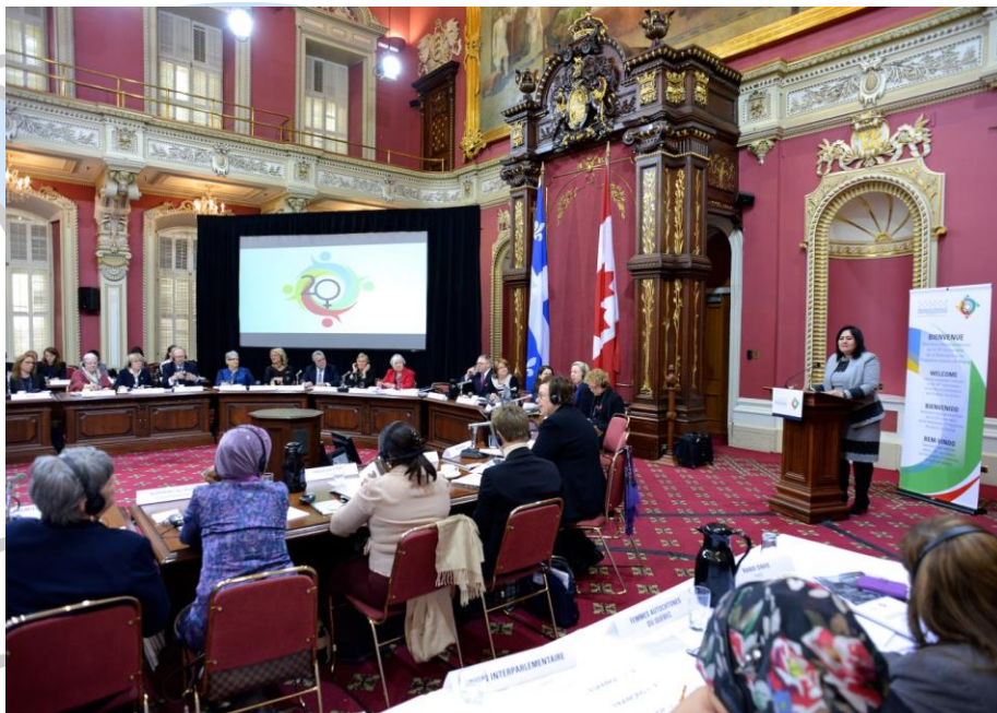
Intervention de la Présidente du Réseau lors du Séminaire

Al finalizar las labores, las mujeres parlamentarias adoptaron una Declaración en la cual se comprometen a continuar trabajando, en el seno de sus respectivos parlamentos, para que la Plataforma de Acción de Beijing pueda rápidamente ponerse en práctica de manera completa y efectiva. Las participantes instaron a las Redes de Mujeres Parlamentarias a movilizar sus integrantes a participar activamente en el proceso de evaluación de los progresos realizados en función de la aplicación de la Declaración y de la Plataforma, que concluirá en marzo de 2015.