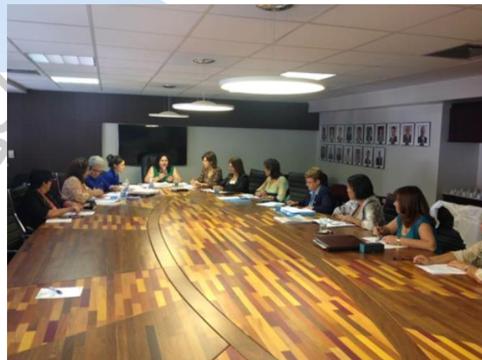
Réunion du Comité exécutif du Réseau des femmes parlementaires Brasilia, 13 octobre 2013

Por otra parte, se discutieron las candidaturas del Comité Ejecutivo y se logró que las parlamentarias ocuparan los diferentes cargos de representantes regionales de la Red, impulsando y concretando el compromiso de las parlamentarias. Las integrantes del Comité Ejecutivo decidieron modificar los estatutos para permitir la reelección de la Presidenta de la Red, por un solo mandato, para el 2013-2015. La aprobación a esta modificación fue unánime y la reelección se llevó a cabo el día 14 de octubre de 2013 en el marco de la XI Reunión Anual de la Red de Mujeres Parlamentarias de las Américas.