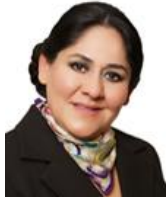
Presidenta / President / Presidente / Présidente Sra. Diva Hadamira Gastélum Bajo, Senadora Cámara de Senadores de la Unión de los Estados Unidos Mexicanos