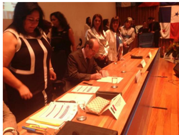
Firma de un acuerdo de colaboración entre la Red y la CIM 14 octobre 2013