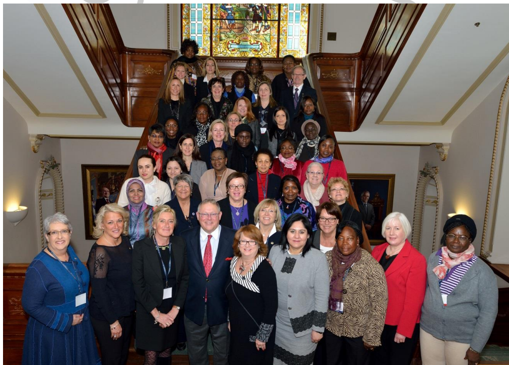
Photographie officielle des participants, Seminario Interparlamentaire