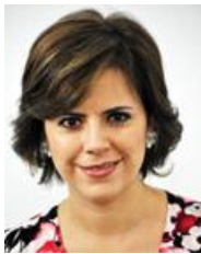
América del Norte / North America / América do Norte / Amérique du Nord Hilda Flores Escalera, Senadora Cámara de Senadores de la Unión de los Estados Unidos Mexicanos