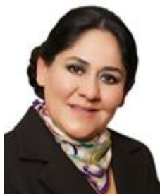
DIVA HADAMIRA GASTÉLUM Sénatrice de la République des États-Unis mexicains