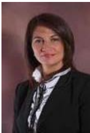
América Central / Central America / América Central / Amérique centrale Sra. Mireya Zamora Alvarado, Diputada Asamblea Legislativa de la República de Costa Rica